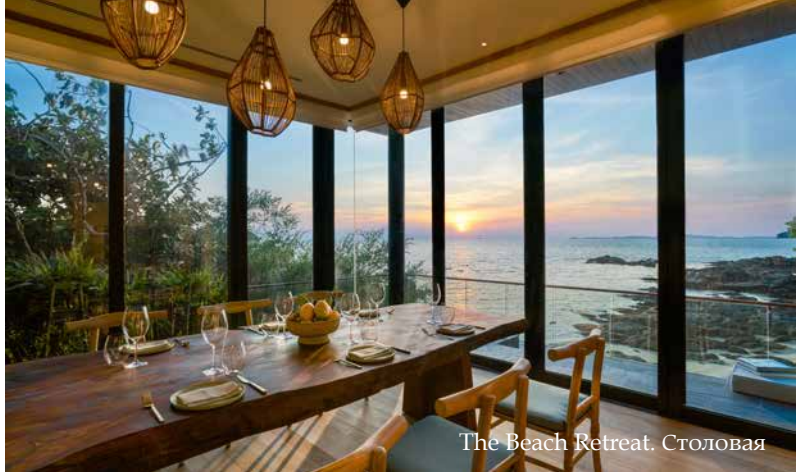
The Beach Retreat. Столовая