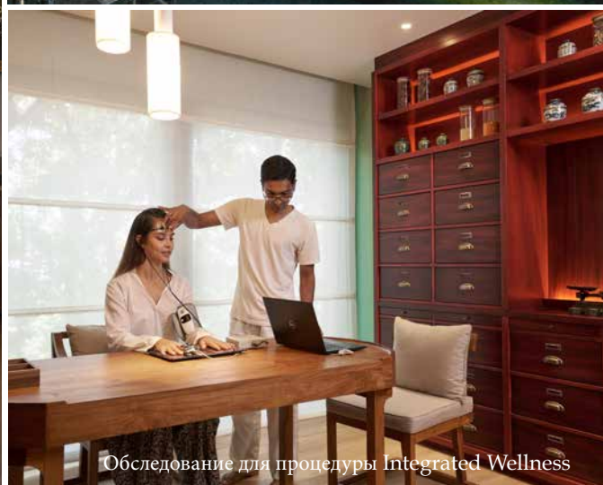
Обследование для процедуры Integrated Wellness