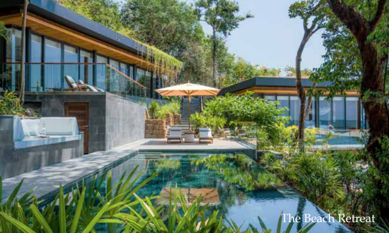
The Beach Retreat