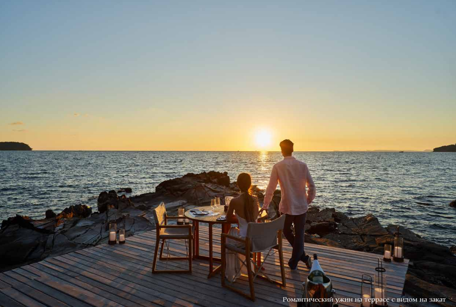
Романтический ужин на террасе с видом на закат