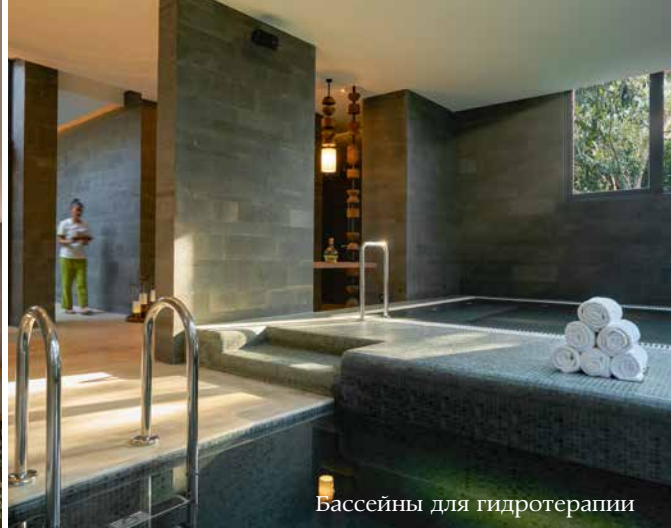
Бассейны для гидротерапии