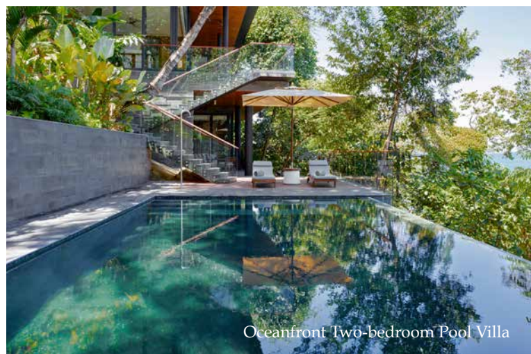
Oceanfront Two-bedroom Pool Villa