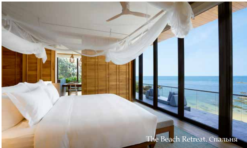
The Beach Retreat. Спальня