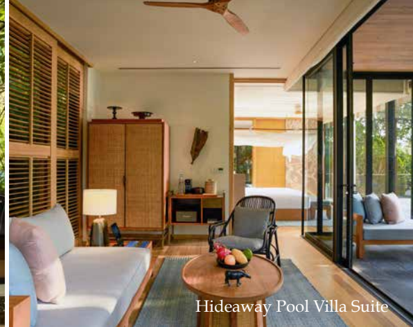
Hideaway Pool Villa Suite