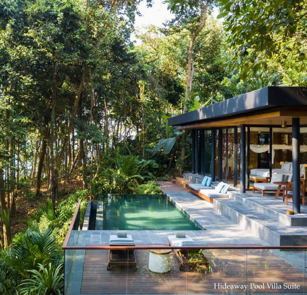
Hideaway Pool Villa Suite