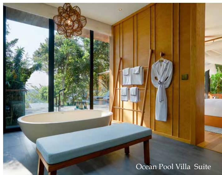
Ocean Pool Villa Suite