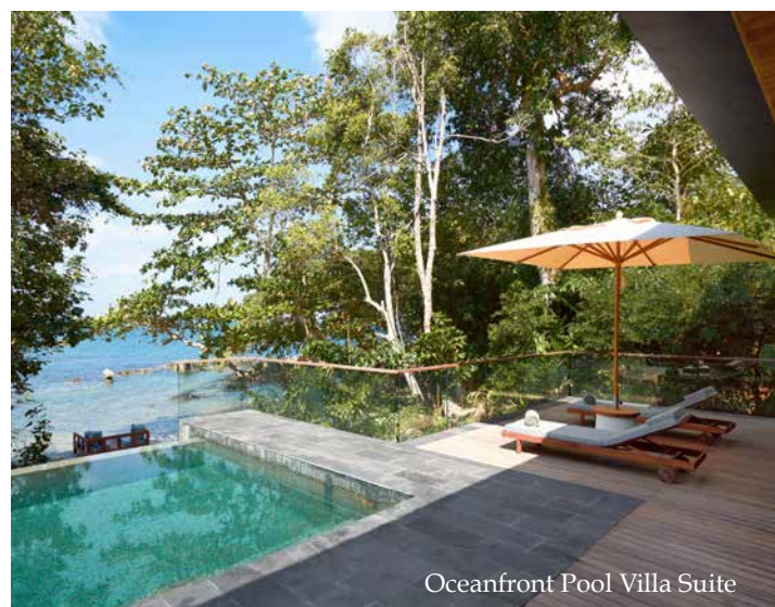
Oceanfront Pool Villa Suite