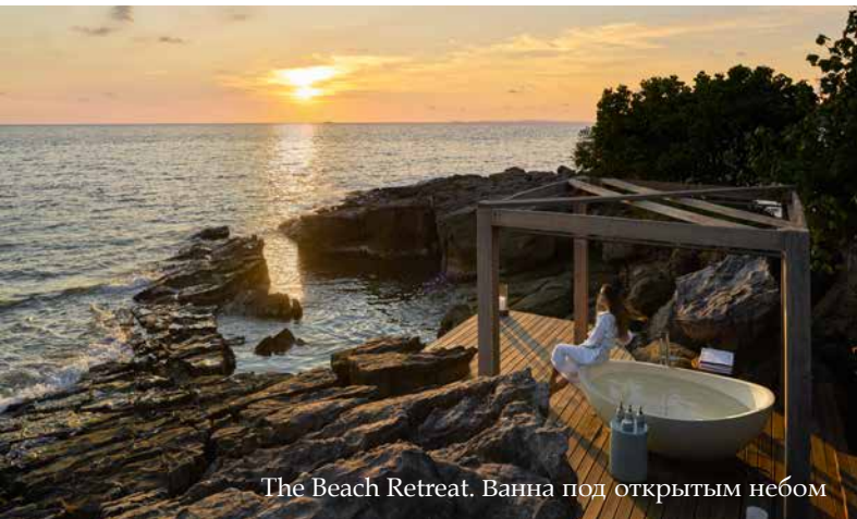
The Beach Retreat. Ванна под открытым небом