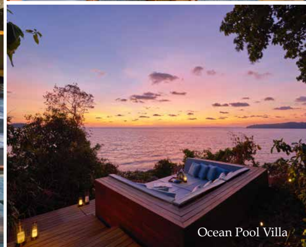
Ocean Pool Villa